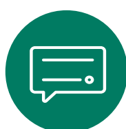
COMUNICAZIONI CON LA PROPRIETÀ