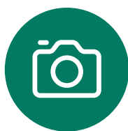
RENDER / FOTO VIDEO PROFESSIONALI/ PLANIMETRIE