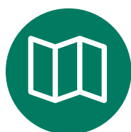
BROCHURE, LEAFLETS E TEASER